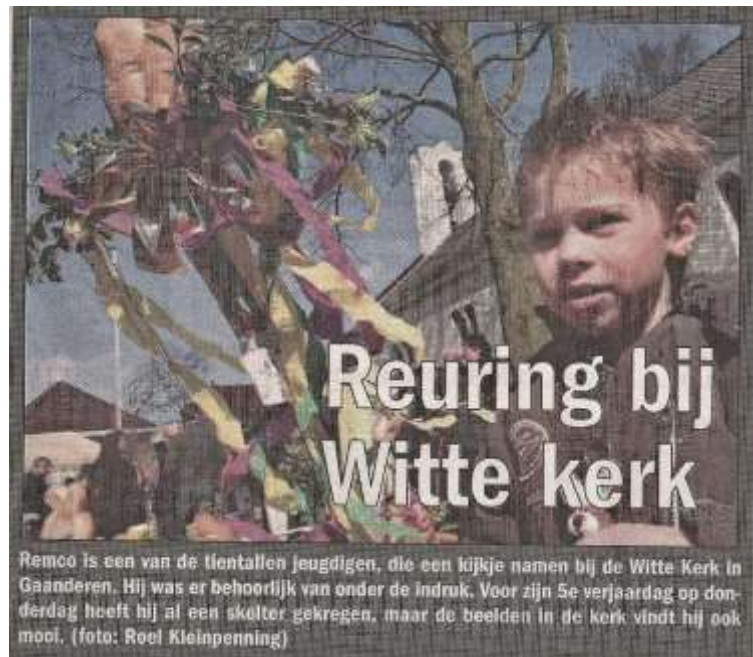
Fig. 6 “Reuring bij Open Dag De Witte Kerk, 2009”