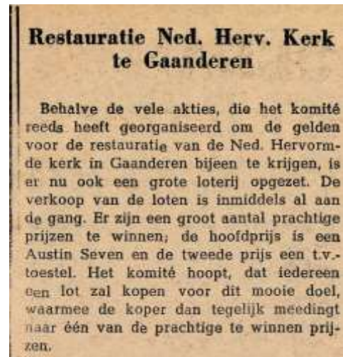
Fig. 3 “krantenknipsel actie voor restauratie 1968”

Hierbij is het torentje gesloopt en vervangen door een eenvoudige klokkenstoel, de kerkzaal verlengd en een balkon aangelegd. Toen is ook de hele kerk witgepleisterd, sindsdien wordt het “De Witte