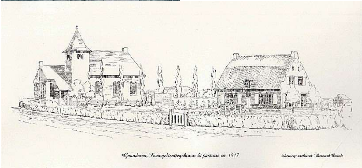
Fig. 2 “tekening Evangelisatiegebouw en pastorie, circa 1917”

Aan de kerk is in 1922, geïnitieerd door ds. Van Dam, een torentje met klok toegevoegd. De klok is in de Tweede wereldoorlog “verdwenen”. Er is in 1948 een nieuwe klok met het opschrift “ ik gedenk de doden en ik roep de levenden ” geplaatst.