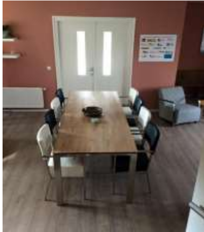
Fig. 9 “De Vlinder, gezamenlijke ruimte”

Ook de pastorie is in de oude stijl gerestaureerd, inclusief de vele zes-, twaalf- en en vijftienruitsvensters en de boven de voordeur aanwezige met zink beklede dakkapel.