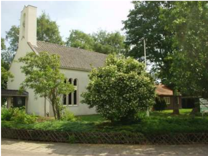
Fig. 4 “De Witte Kerk bij verkoop in 2014”