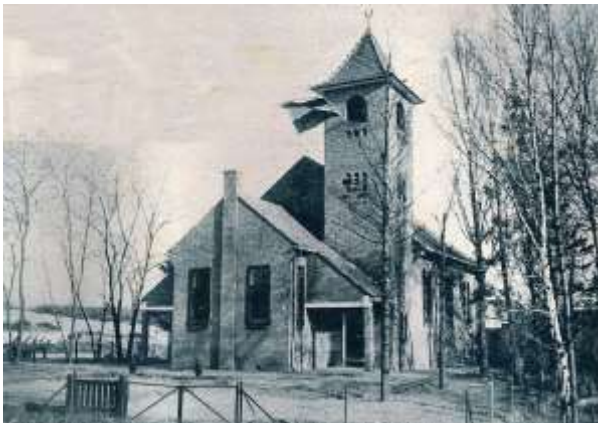
Fig. 1 “kerk in 1938 bij het 25-jarig bestaan”

Het “witte kerkje” van de hervormde gemeente aan de weg van Oud naar Nieuw Gaanderen, de Hoofdstraat in Gaanderen, werd op 6 februari 1913 in gebruik genomen. Het ontwerp ervan was van architect Ovink uit Doetinchem.